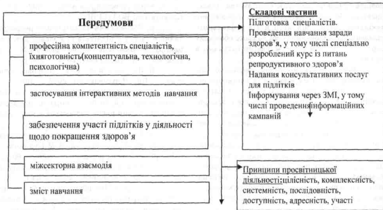
Рис.1. Модель просвітницької роботи з підлітками щодо збереження та зміцнення репродуктивного здоров'я

Соціально-педагогічні аспекти формування відповідального ставлення до здоров'я ми представляємо в моделі просвітницької роботи з підлітками щодо збереження та зміцнення репродуктивного здоров'я (рис. 1).